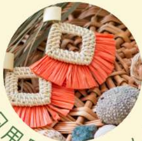
日用品・ハンドメイド