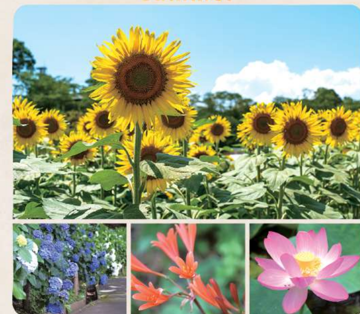
上段：ヒマワリ 下段【左から】：アジサイ/キツネノカミソリ/ハス