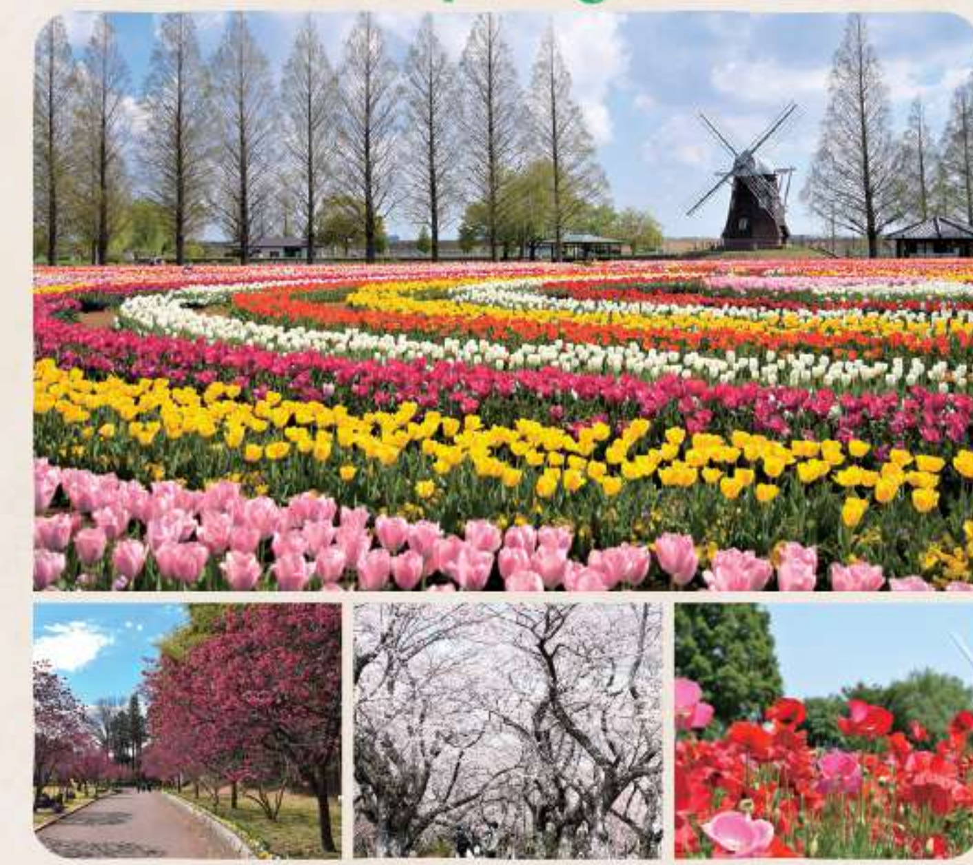
上段：チューリップ 下段【左から】：カンヒザクラ/サクラ/ポピー