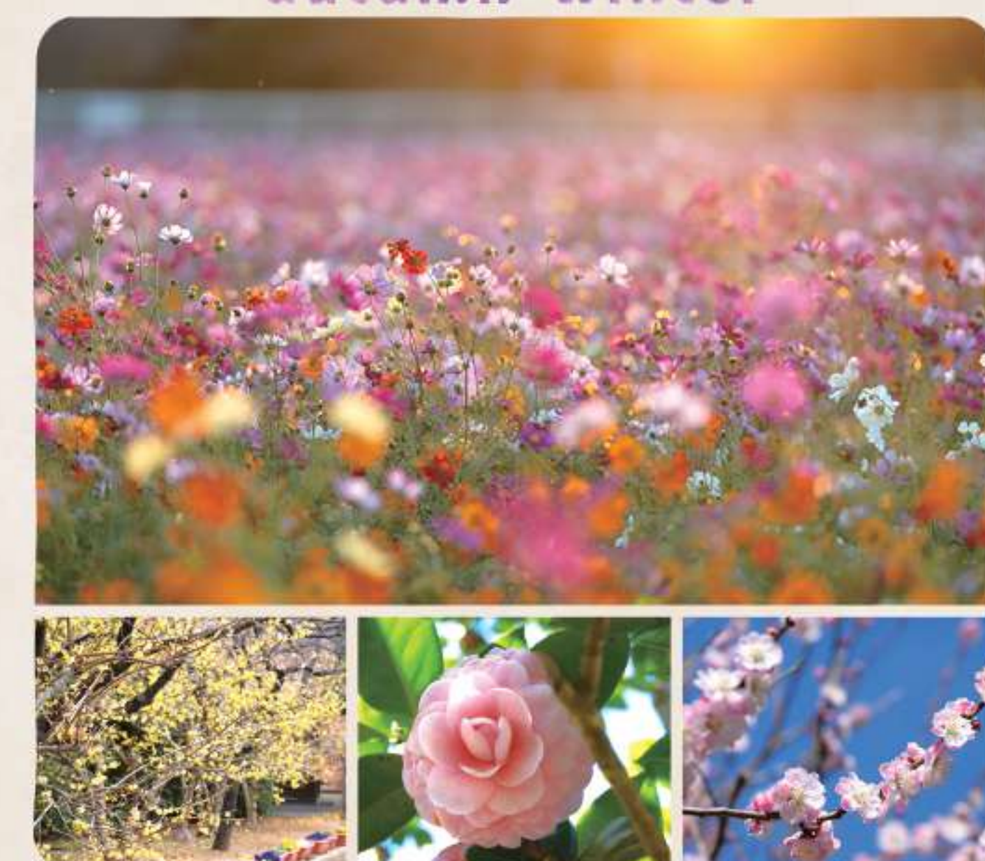
上段：コスモス 下段【左から】：ロウバイ/ツバキ/ウメ